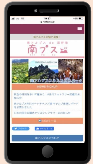
スマートフォン版