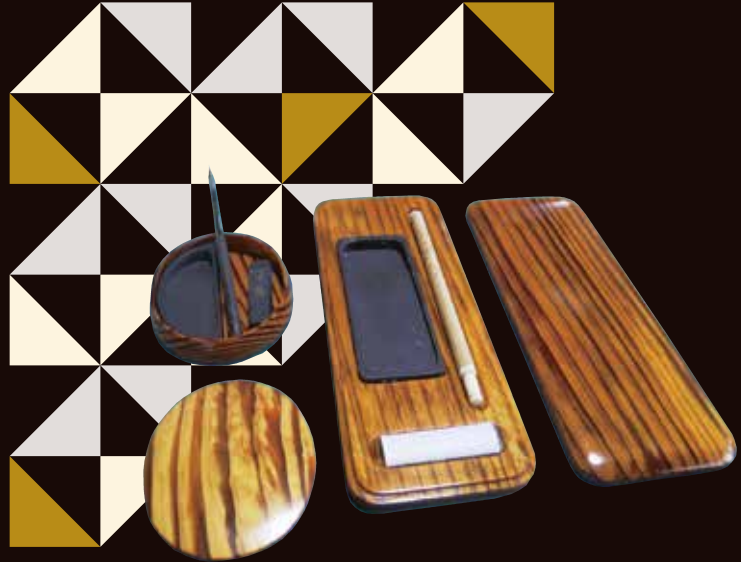
小判型硯箱・硯箱