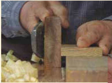
下田脂松細工製作風景