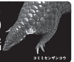
コミミセンザンコウ

ミュージアムが新たに収蔵した自然史標本の中から選りすぐりの逸品を特別公開します！