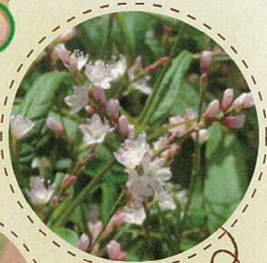
サクラタデ タコノアシ