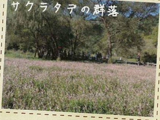
サクラタデの群落