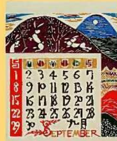
「昭和43年9月 型染カレンダー」(1967)

1955(昭和30)年、芹沢銈介が自邸内に設立した芹沢染紙研究所。そこで制作されたカレンダー、うちわ、グリーティングカード、包装紙、額絵、絵葉書、風呂敷、ふきんなど、多彩な日用品300点を通じて、その仕事の豊かさをご覧ください。