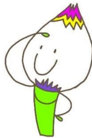
おかんじゃけ君 地域に伝わる郷土玩具 「おかんじゃけ」のキャラクター