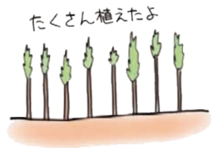
成長に応じて本数を減らします。(間引き)