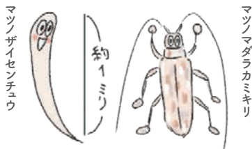
カミキリがかじった元気なマツに線虫が侵入