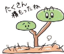
落ちた松葉が土地の栄養になります。

マツ材線虫病は明治時代、北アメリカから日本に来た小さな線虫「マツノザイセンチュウ」が引き起こす、マツの命とりになる病気です。この病気にかかるとマツは根から水を吸い上げられなくなり、枯れてしまいます。