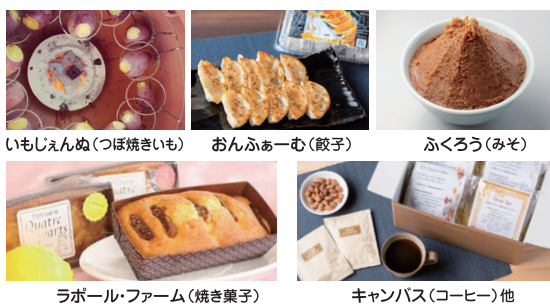
いもじえんぬ(つぼ焼きいも) おんふあーむ(餃子) ふくろう(みそ) ラポール・ファーム(焼き菓子) キャンパス(コーヒー)他

協力 NPO法人 オールしずおかベストコミュニティ 静岡県内の障がいのある人たちが、地域の福祉事業所において、ひとつひとつ丁寧に手づくりしている製品を販売します。このぬくもりと質のよさを、ぜひお確かめください。多くのおみなさまのご来館お待ちしております。