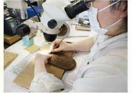
出土品の保存処理事業