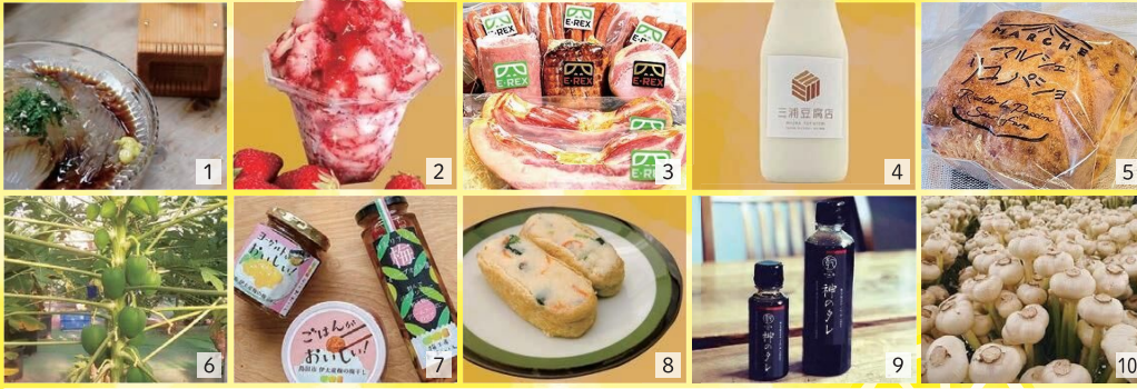
[出店予定ブース] 1 旬の会 2 ヤマサン農園 3 (株) E-REX 4 三浦豆腐店 5 佐野ファーム 6 内牧ババイヤ農園 7 梅工房おおいし 8 淡竹屋 9 炭焼鯉かん吉 10 げんき農園

500円以上のお買い上げでステキなプレゼントが当たる楽しいゲームに参加できます♪ ◆ 出店内容は変更になる可能性があります。 ◆ お買い上げ品のミュージアム館内での飲食はご遠慮ください。 ◆ 小雨決行。当日朝9時頃にHPにて開催の可否をご案内します。 ◆ 写真・イラストはイメージです。