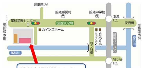
薬科生涯学習センター