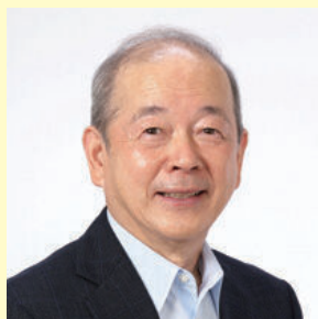
ゲスト 宮川 秀俊 愛知教育大学名誉教授