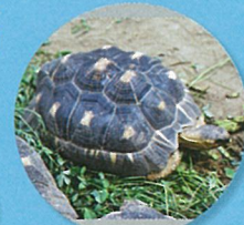
マダガスカルホシガメ